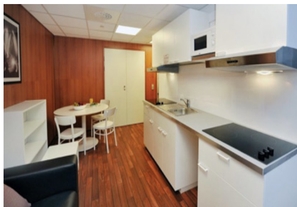
住宿标准：学生公寓标准的双人房 住宿参考图片