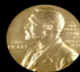
President Martti Ahtisaari was awarded the Nobel Peace Prize in 2008.

"I promised my support to the institute, if it is a part of normal activities and provides added value to the planned projects. I am glad that the University of Oulu is proceeding in economic and business sciences." (President Ahtisaari in the grand opening ceremony of the institute in 2008)