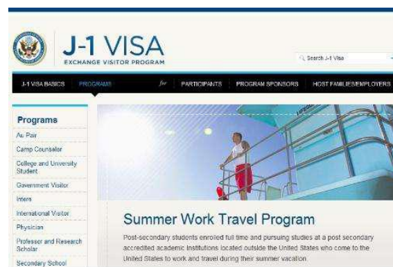
美国国务院官方网站项目介绍

大学生暑期赴美带薪实习项目（Summer Work & Travel USA Program）为美国国务院文化交流局主办的美国官方项目，项目受美国国会立法保护，并在美国驻华各领事馆备案，使项目的安全性和权威性有着良好的保障，并有着极高的签证过关率。